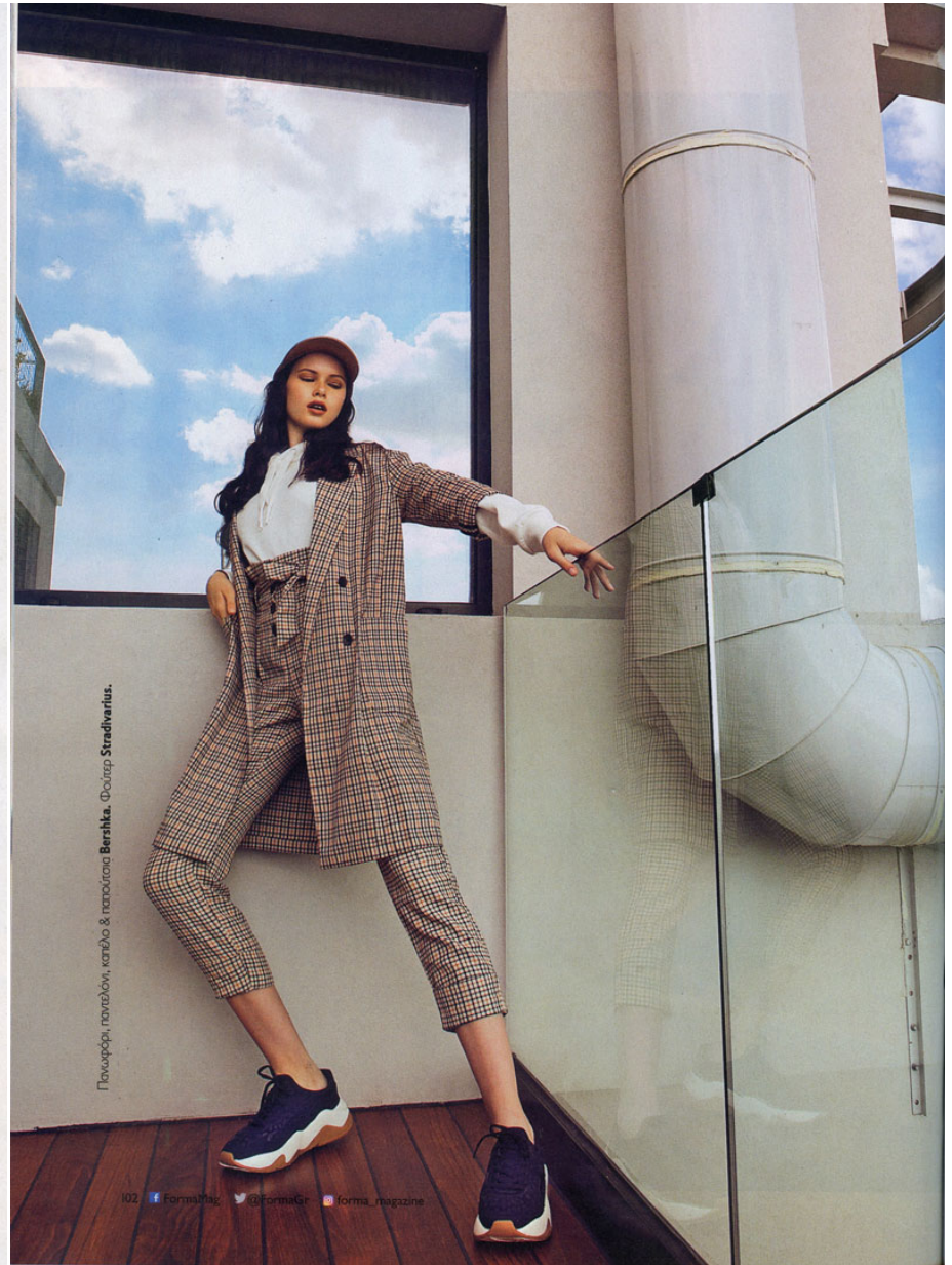
Πουαρόφι, παντελόνι, κομμάτι & παπούτσι Bershka. Φούτερ Stradivarius.