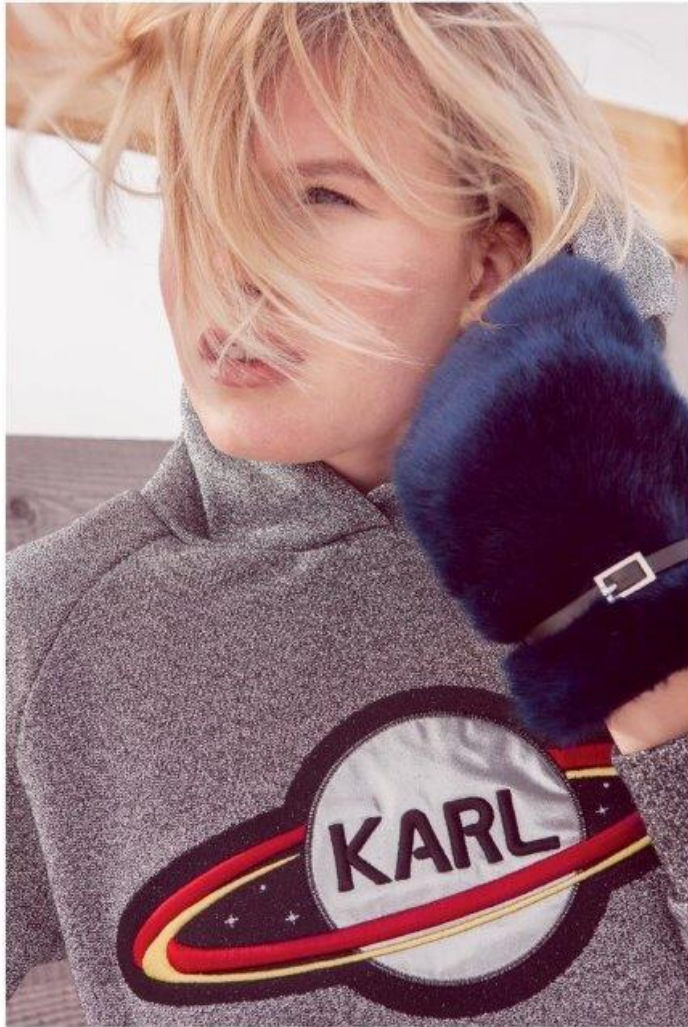
Město: Karl Lagerfeld , 6500Kč, rukavice: Mohito , 379Kč