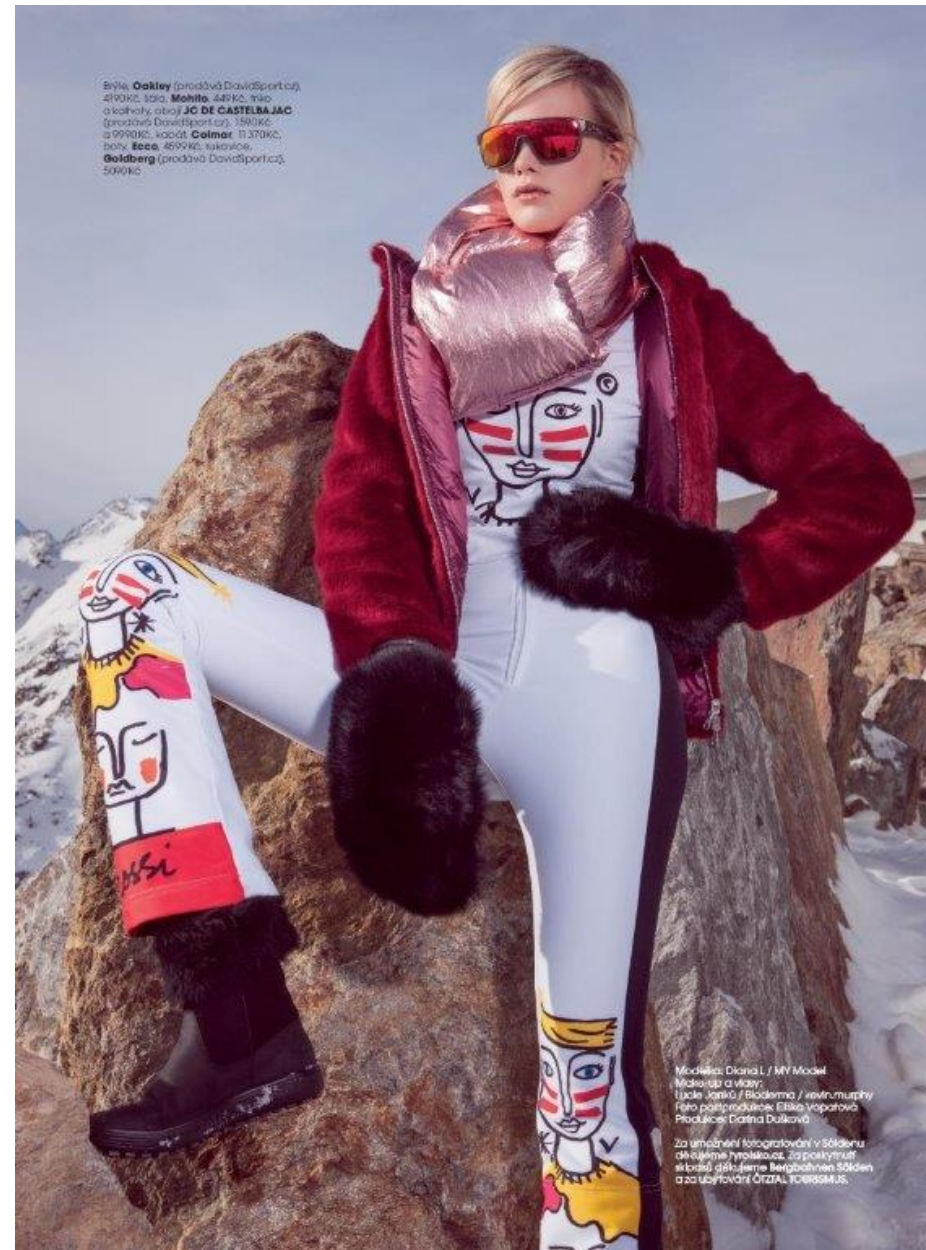
Brýle: Oakley (prodává DavidSport.cz), 4190Kč, šála: Mohito , 449Kč, triko a kalhoty, obuv: JC DE CASTELBAJAC (prodává DavidSport.cz), 1961Kč, 21990Kč, kabelka: Calmar , 11370Kč, boty: Esca , 4699Kč, rukavice: Goldberg (prodává DavidSport.cz), 5090Kč